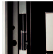
Rostro di sicurezza

Costruita interamente in acciaio zincato e verniciato, funziona come una persiana blindata con apertura verso l'esterno e con gli stessi elementi di sicurezza.